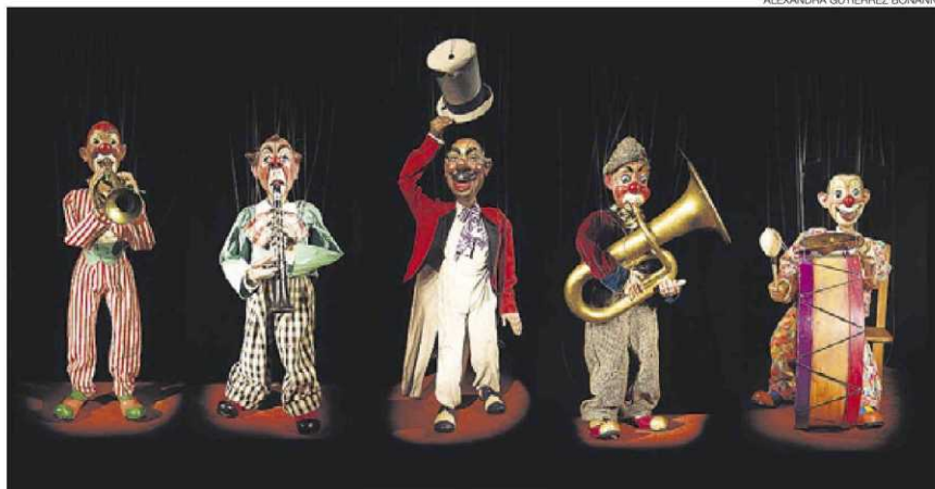
►► Titelles de la banda de fusta de la Cia Herta Frankel (Trompo, Rinete, Monsieur Pascual, Tubo i Mingo), del 1961.