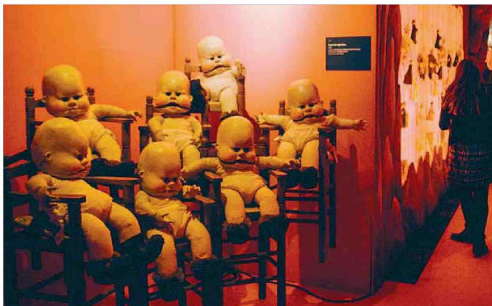
Un detall dels petits ogres a la porta de l'infern, a l'exposició 'Figures del desdoblament' a l'Arts Santa Mònica