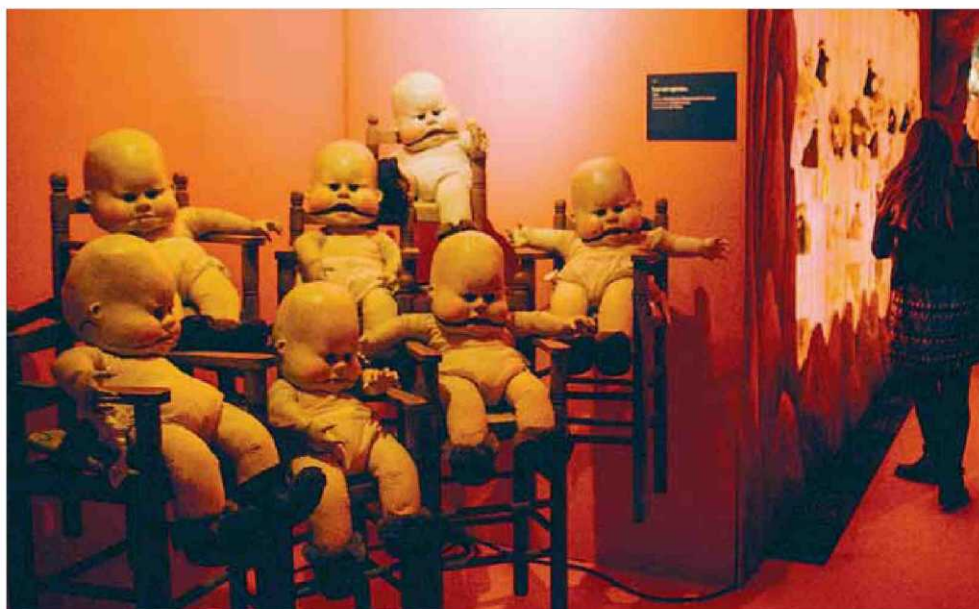
Un detall dels petits ogres a la porta de l'infern, a l'exposició 'Figures del desdoblament' a l'Arts Santa Mònica