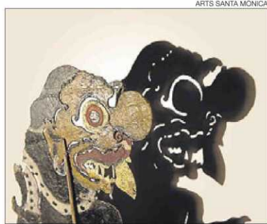
►► Figura del teatro de sombras de Bail.

La exposición se articula en tres ámbitos. En la primera planta del centro están Les 7 portes de l'alteritat ,