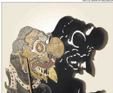
►► Figura del teatre d'ombres de Bail.

L'exposició s'articula en tres àmbits diferents. A la primera planta del centre hi ha Les 7 portes de l'alt-