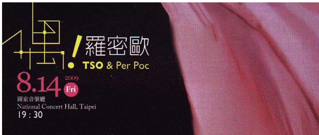
Anunci d'una actuació de la companyia Per Poc a Taiwan.