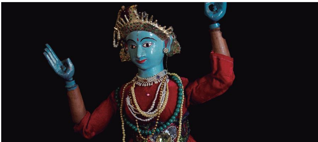
Vishnu. Col·lecció Eugenio Navarro.