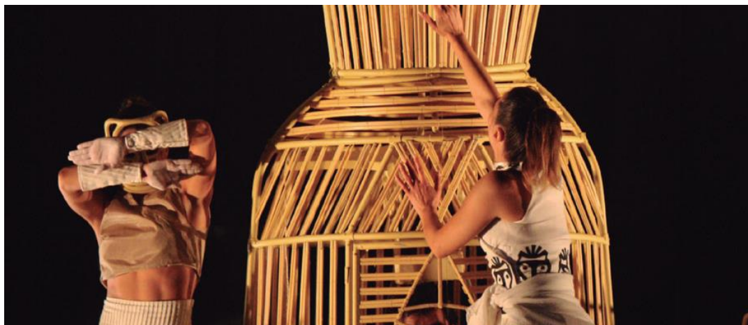
Pandora. Artristras.