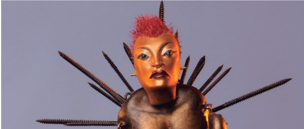
Isra. Construcció: Ety Fefer.