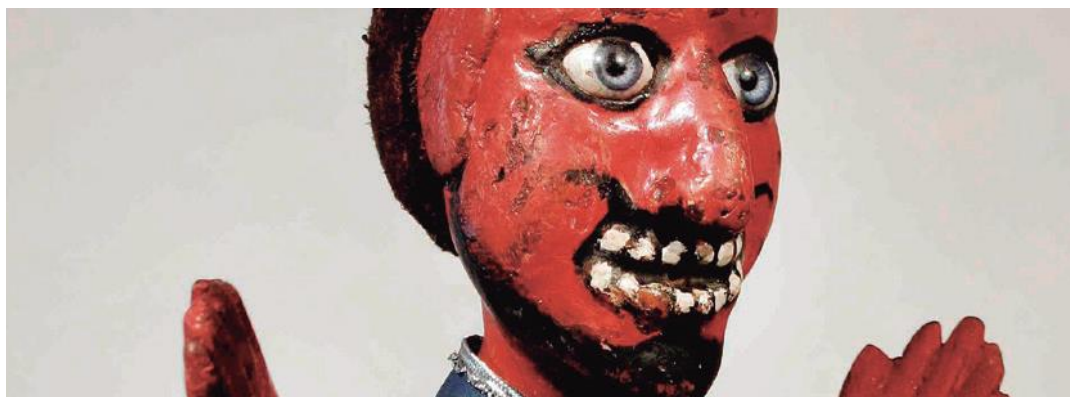
Banyeta. Titelles Vergés.