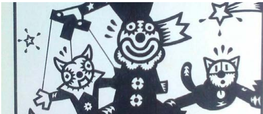
Il·lustració de Jaume Anglès.

L'exposició paral·lela El personatge infinit versa sobre les obres d'en Jaume Anglès. Es tracta d'una exposició de làmines de dibuixos que es realitzarà a l'escala del Centre d'Arts Santa Mònica i que pretén donar valor a una trajectòria completament submergida a la realitat local.