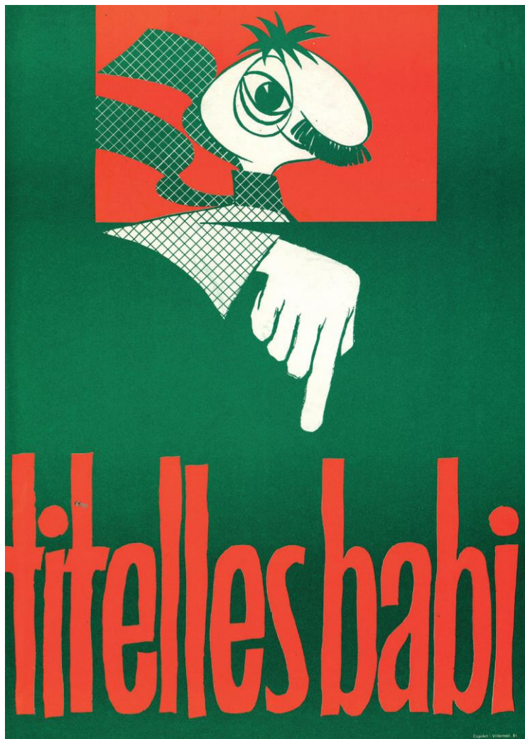
Cartell de la companyia Titelles Babi, 1980. MAE.

L'interès que suscita avui dia el món de l'objecte i de la iconografia essencial del teatre de titelles és fruit d'un treball intens de molts artistes. Des del final de la dècada del 1960 i el començament dels 70, la codificació del titella ha incorporat a les velles tradicions totes les inquietuds de l'art contemporani. Pintors, escultors, artistes plàstics en general i escriptors han trobat en el titella una forma d'expressar la realitat dual de l'individu contemporani, la seva alienació i les seves projeccions. L'experiència acumulada dels professionals en els últims 40 anys fa que, avui, aquest ofici s'hagi convertit en una forma sòlida de comunicació artística de la realitat. En aquesta secció, hi trobareu imatges, textos i cartells. Una realitat d'una riquesa inaudita, amb companyies històriques que han picat pedra any rere any i una explosió de nous creadors amb ganes de capgirar les tradicions i d'explorar els nous camins que ens suggereixen la tecnologia, els nous materials i les diferents perspectives de l'esdevenir.