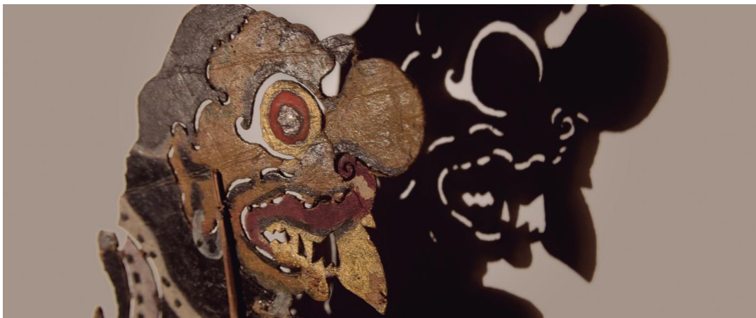
Personatge del teatre d'ombres de Bali. Col·lecció Toni Rumbau. Foto de Jesús M. Atienza