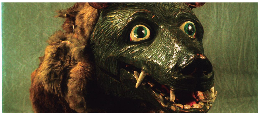
Cap de llop. Fons Ezequiel Vigués, Didó. MAE. Foto de Pep Parer.