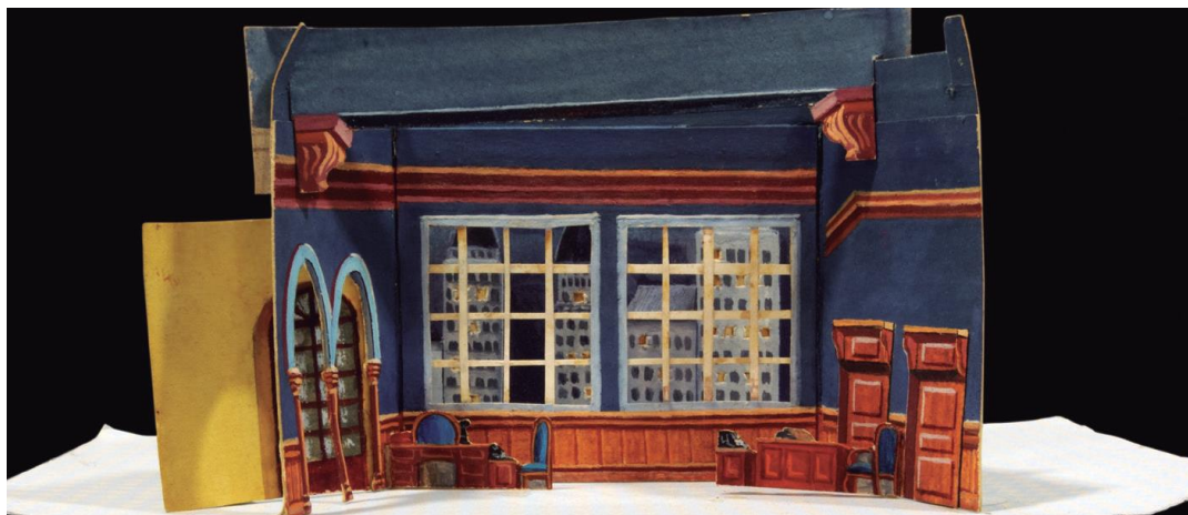
Reproducció a escala d'un decorat d'òpera per a representació domèstica. Fons Respall. MAE.