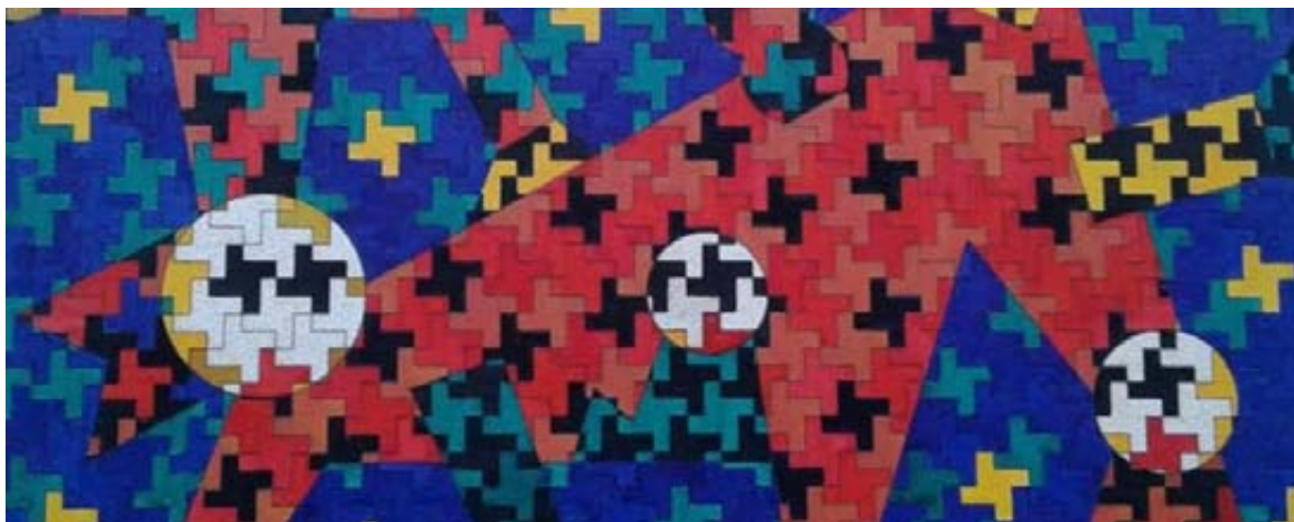
Il·lustració de Jaume Anglès

El patrimoni artístic de Jaume Anglès testimonia l'evolució de diverses manifestacions de l'art popular català. Però, lluny de la dimensió folklòrica i del que s'ha anat consolidant com una concepció majoritària, Anglès s'ha mogut sempre en el territori alternatiu de l'avantguarda. Pouant en la seva pròpia tradició familiar (Jaume Anglès ve de família de titellaires), el seu treball és el d'un militant de l'espontaneïtat de l'art del carrer, la subversió i la provocació. Les ressonàncies d'altres artistes plàstics anteriors i contemporanis d'Anglès, la majoria també catalans (Ponç, Miró, el dibuixant de còmics Max...), són una prova de la continuïtat i la consistència que té l'avantguarda a casa nostra; no només en l'art, sinó també en la vida quotidiana. D'altra banda, l'excèntrica personalitat de l'obra de Jaume Anglès el situa en una frontera del territori comú i és una mostra de la seva efervescència.