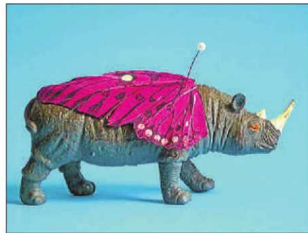
MIQUEL ÀNGEL LLONOVOY